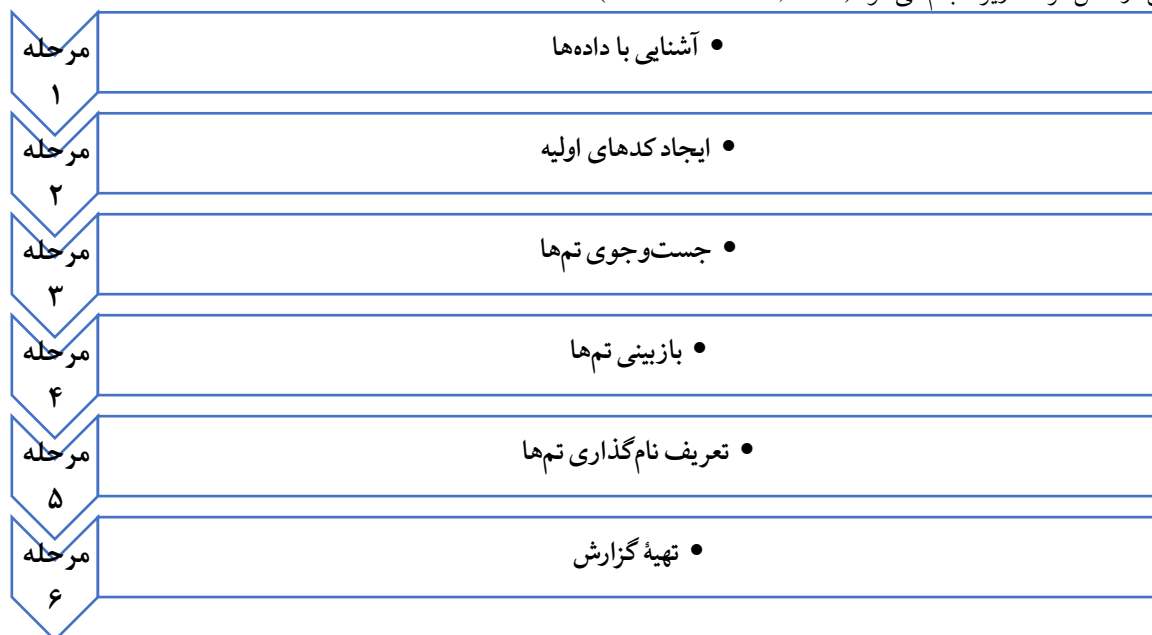
شکل ۱: مراحل روش تجزیه و تحلیل تم (Clarke & Braun, 2013)

فرایند تحلیل تم از همان مرحله اول آغاز می‌شود، زمانی که تحلیلگر الگوهای معنایی و موضوعاتی را که جذابیت دارند مدنظر قرار می‌دهد. این تحلیل شامل یک رفت‌وبرگشت مداوم بین مجموعه داده‌ها و خلاصه‌های کدگذاری شده و تحلیل داده‌هایی است که به وجود می‌آیند. این روش در شش مرحله زیر انجام می‌شود (Clarke & Braun, 2013).